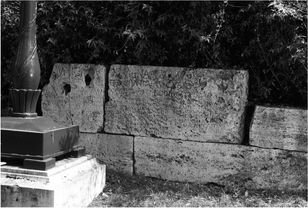
Fig. 9. Blocchi della sepoltura collettiva restaurata da M. Licinius Mena . Roma, Villa Wolkonsky.

restauro dell'edificio sepolcrale destinato ai membri dell'associazione, previa autorizzazione dei decurioni (n. 13) (fig. 9). L'iscrizione, come si è visto, incisa su due blocchi accostati, doveva essere collocata sulla fronte del sepolcro e conteneva, oltre a quanto detto, i nomi dei magistri e dei decuriones del collegio. In condizioni di forte visibilità era dunque esposto il ricordo di un atto evergetico, sia pure relativamente ad un edificio privato e non di utilità pubblica, compiuto da un liberto e collegava, attraverso un legame indissolubile, il nome del liberto stesso, quello del suo patrono (una donna in questo caso) e quello di un collegio che doveva pur godere di qualche autorevolezza. La seconda, la choraule Licinia Selene (n. 9), il cui nome compare in un sepolcro individuale destinato a un'esposizione esterna, intende sottolineare nel titulus in latino di essere una liberta di un M. (Licinius) Crassus , mentre nel titulus greco ricorda solo il suo cognome e la professione: alla differenza linguistica e culturale dei potenziali lettori si accompagnavano le diverse informazioni fornite.