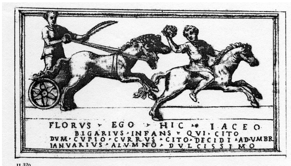
Fig. 6. Iscrizione di Florus. Perduta. Disegno tratto Pirro Ligorio, Libro delle iscrizioni dei sepolcri antichi (Napoli – volume 8), S. Orlandi (ed.), Roma, 2010, 315.