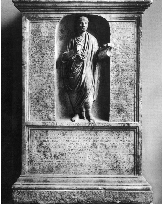
Fig. 1. L'ara di Q. Sulpicius Maximus . Roma, Musei Capitolini.

aveva pianta quadrata e una piccola cella di forma rettangolare 56 ed era destinato ad ospitare i membri della synhodos m(agna) psaltum (su questo torneremo): è da segnalare che, non lontano da qui, nella zona del Piazzale di Porta Maggiore, nel primo quarto del I secolo a.C., era stato costruito il sepolcro della societas o synhodos cantorum Graecorum e, nella prima età imperiale, sarebbe stato edificato il colombario che ospitava gli scabillarii . Senza voler parlare di un'area destinata ad ospitare gli specialisti della scena teatrale, sembra di notare una preferenza per questa parte della città di antica vocazione sepolcrale e che nel passaggio dalla Repubblica all'Impero aveva conosciuto una rivalutazione ad opera di personaggi strettamente legati alla corte augustea.