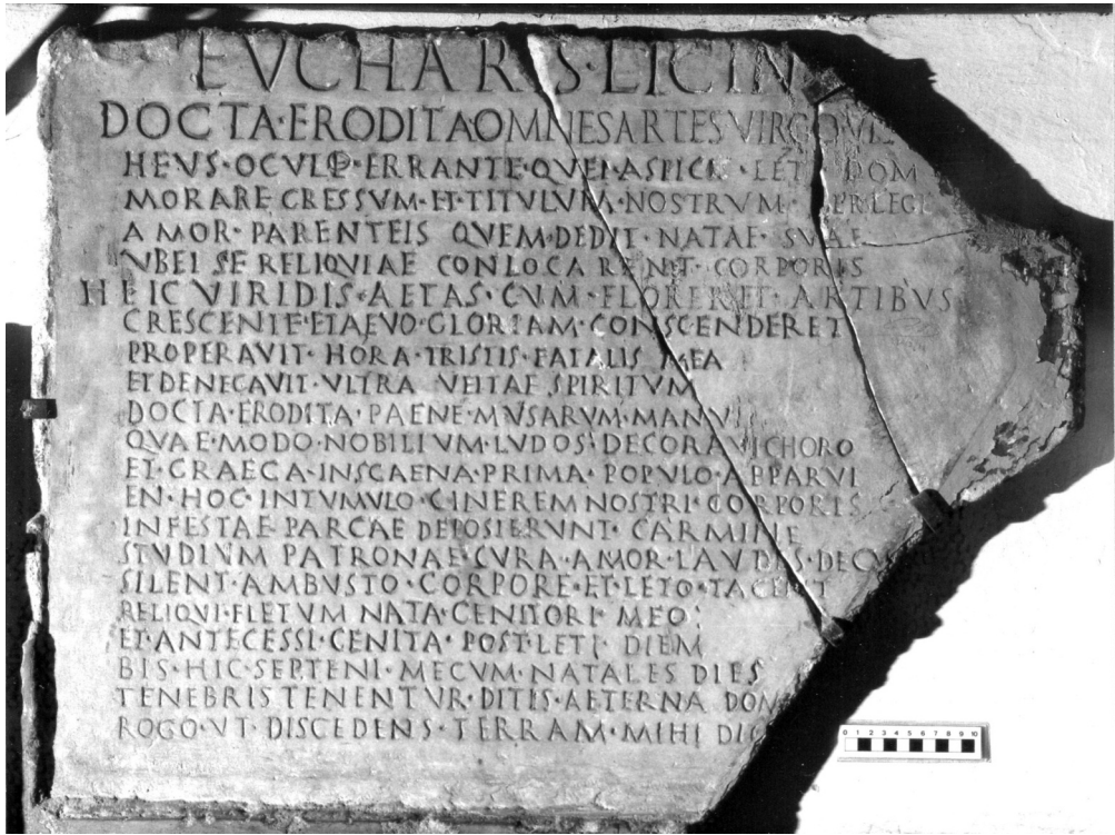
Fig. 7. Lastra di Eucharis . Roma, Pontificio Istituto di Archeologia Cristiana, via Napoleone III.

re, inoltre, che il primo dei due dattili elegiaci ripete una formula ( hic est ille situs ) che, come ha fatto osservare Massaro per un'altra composizione poetica, ha un archetipo illustre: l'epigramma sepolcrale per Scipione Africano Maggiore, comunemente attribuito ad Ennio. 87 La formula sembra avere una discreta diffusione in iscrizioni metriche o metricheggianti, a partire dall'età repubblicana. 88 In questo caso, la formula è utilizzata per introdurre sia il nome del defunto, corredato dall'indicazione della professione, sia una proposizione relativa che funge da epesegesi al pronome ille . Quanto a questa, se si esclude la clausola frequente dum vixi(t) , non sembra trovare, in tale forma, confronti.