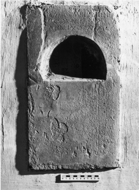
Fig. 3. Stele di Licina Selene . Roma, Musei Capitolini.

individui, verosimilmente due liberti di Eutyclus , introduce formule di divieto, ribadisce la destinazione familiare del sepolcro.