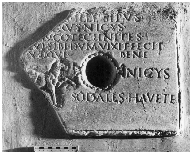
Fig. 4. Lastra di Nicys . Roma, Villa Aldobrandini.

(n. 13); o infine il poeta Graecus Q. Sulpicius Q. f. Cla. Maximus , che partecipò alla terza edizione dell' agon Capitolinus domiziano (94 d.C.), concorrendo con altri 52 poeti greci (n. 14): nonostante l'entusiasmo suscitato negli spettatori, non vinse la gara ma si allontanò con onore e con i suoi soli 11 anni «andò dall'arena all'Adè», come lui stesso ci racconta nel breve epigramma che segue l'iscrizione latina in prosa. I genitori vollero ricordare il figlio facendo erigere l'ara presentata sopra, in cui fecero incidere il testo del componimento che il giovane avrebbe composto per la manifestazione romana.