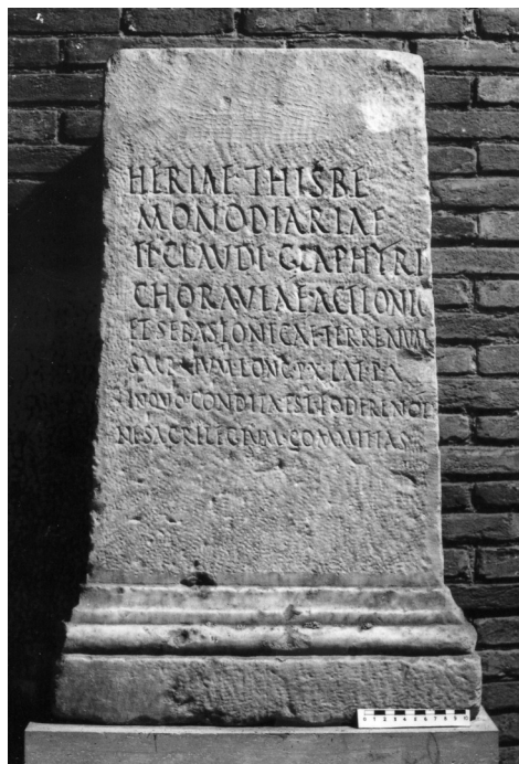
Fig. 2. L'ara di Heria Thisbe . Roma, Musei Capitolini.

riore e, nel campo epigrafico, una iscrizione latina, in prosa, ed un'iscrizione in greco, in versi; il registro superiore è dominato da una nicchia centrale con l'immagine in rilievo del defunto, vestito di tunica, toga, calcei e con un volumen parzialmente srotolato nella mano sinistra, mentre negli spazi rimasti vuoti lateralmente sono incisi i versi in greco che il giovane defunto avrebbe pronunciato in una gara poetica (su questo torneremo). Urceus e patera spiccano in rilievo sui fianchi dell'ara. La qualità del monumento unitamente alla scelta del luogo per la sepoltura mostra una chiara intenzione di visibilità.