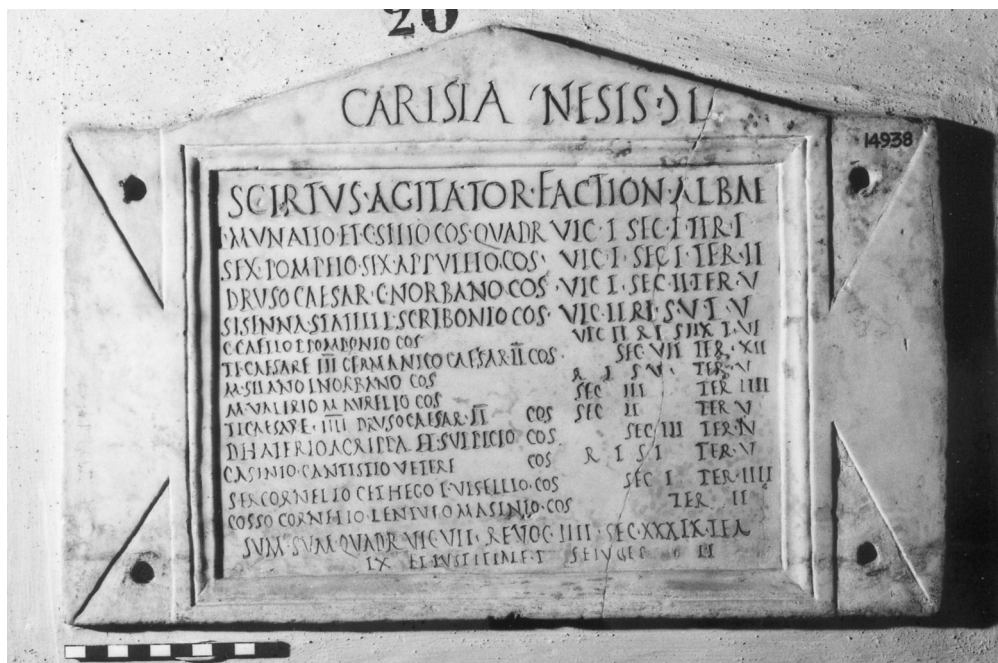
Fig. 5. Lastra di Scirtus. Roma, Musei Vaticani.