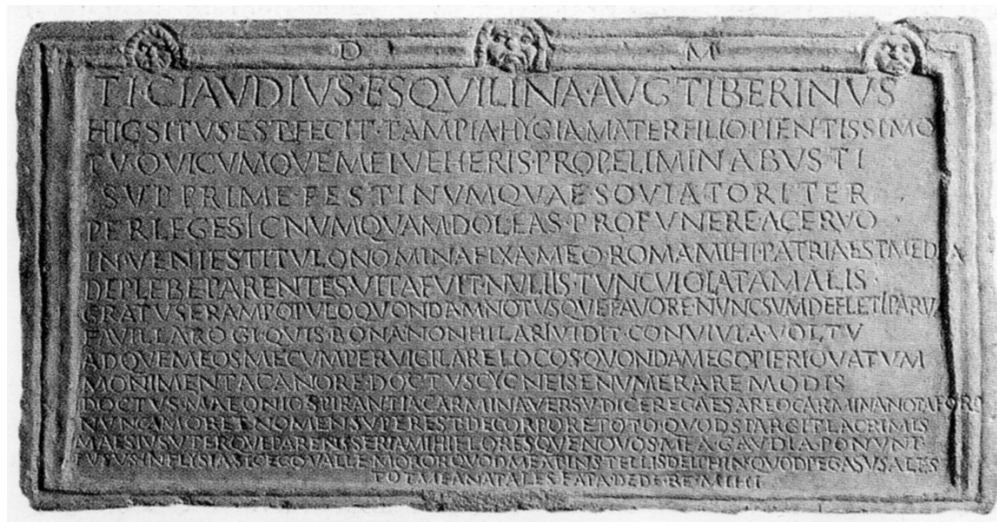
Fig. 10. Lastra di Ti. Claudius Tiberinus . Roma, Museo Nazionale Romano.

versi. Nel testo latino, in prosa, i genitori, che pongono la dedica, si sentono in dovere di aggiungere ai consueti dati sia l'accento ad un evento biografico centrale nella vita del giovane defunto, essenziale per comprendere l'insieme del monumento, sia la spiegazione di ciò che il passante andrà a leggere ( versus extemporales ). Nell'epigramma in greco, costituito da 20 distici elegiaci, è lo stesso Maximus a prendere la parola e, ripetendo molti luoghi comuni dell'epigrafia funeraria, 94 a rivolgere l'invito al passante a leggere i versi improvvisati (σχεδίου γράμματος) che gli renderanno gloria immortale. Sono proprio questi versi a costituire elemento di grande interesse, poiché si tratta della trascrizione su pietra 95 dei 43 esametri che il giovane avrebbe presentato nella edizione dell' agon Capitolinus del 94 d.C.: 96 in questo si tratta di un unicum . Ad eternare l'immagine di quel momento, non solo il giovane è raffigurato nell'atto della recitatio , ma il testo da lui composto continua nel volumen che tiene semiaperto nella mano sinistra.