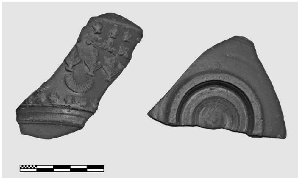
Fig. 3. Fotografía de la superficie exterior de la pieza de León que aquí presentamos.

voco de que nunca estuvo expuesta a la vista. Ambas características, ausencia de engobe interior y carena reentrante en la parte superior permiten proponer con cierta seguridad que se trata de una forma cerrada, probablemente una jarra, cuyos rasgos morfológicos no tienen paralelo alguno, hasta el momento, en las producciones de sigillata hispánica.