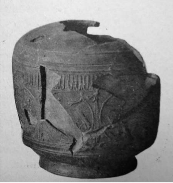
Fig. 4. Pieza de Montans (Durand-Lefebvre, 1954: 75, fig. 1, n.º 3).

sobre vasos de Montans (1954: 75, fig. 1, n.º 3). El autor lo clasificaba como «no identificado». Este mismo recipiente aparece en un trabajo de Romero Carnicero (1983: 130-131) como una lagena con una forma parecida a la Hisp. 20 (fig. 4).