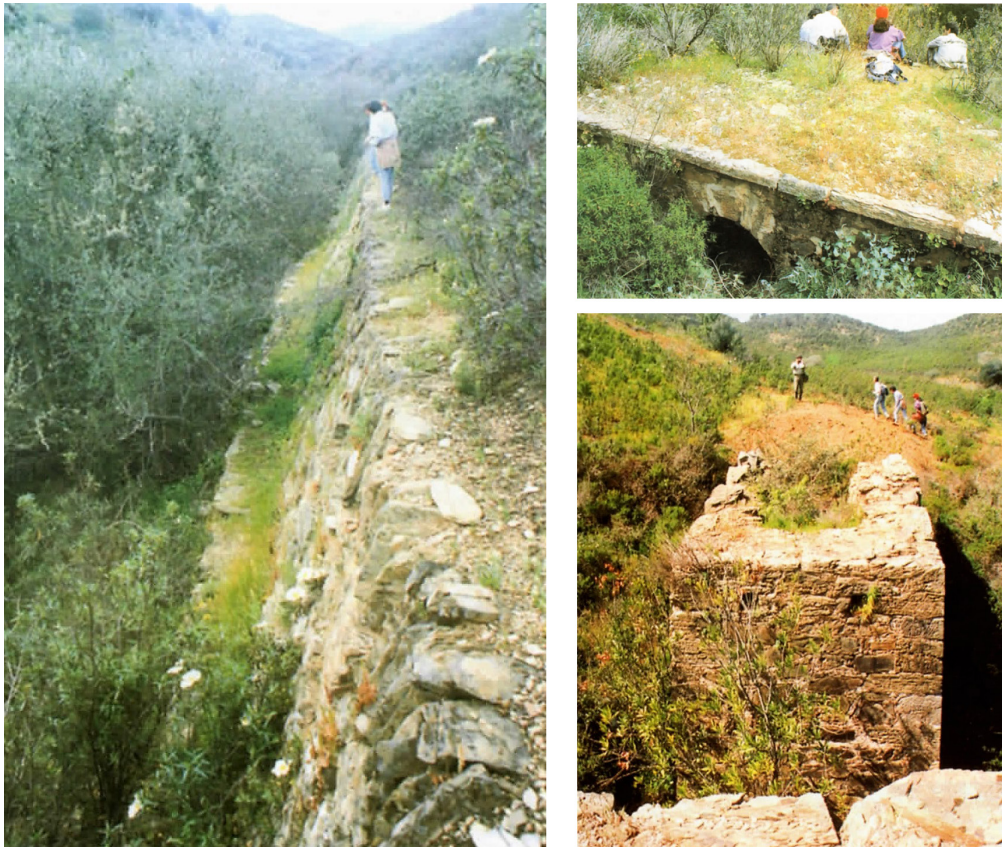
Figura 2. Infraestructuras de la plataforma y obras de infraestructura del ferrocarril (Ruiz Acevedo 1998: 142-143, láms. 3 a 5).

ferrocarril en Riotinto por D. Joaquín Ezquerro (autorizado en 1853, aunque no llegó nunca a realizarse), pero matizó que este proyecto no habría pasado en la zona de Cabezo de los Estandartes (lugar donde se indica la estructura monumental), ya que no existen evidencias de explotación minera que lo hiciesen necesario, puesto que la vía XXIII se abandonaría tras la Edad Media.