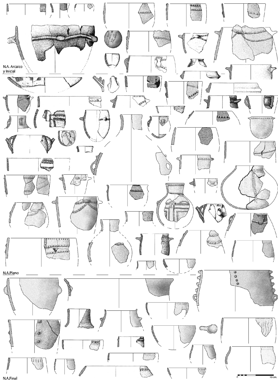
Figura 4. Propuesta de tendencia evolutiva de la cerámica de la cueva de Nerja durante el Neolítico antiguo.