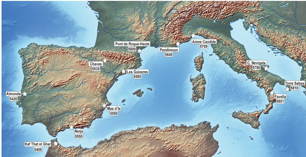
Figura 3. Gradación cronológica de la llegada del Neolítico a la costa andaluza. Las fechas corresponden a la media cal BC de dataciones sobre cereales (Bernabeu et al. , 2003; Binder y Sénépart, 2010; Natali, 2010; Guilaine et al. , 2016), excepto Les Guixeres de Vilobí (Orms et al. , 2014), Chaves (Baldellou, 2011), Nerja (Aura et al. , 2013) y Kaf Taht El-Ghar (Martínez Sánchez et al. , 2017), que son sobre sobre Ovis aries , y Almonda, sobre adorno (Zilhão, 2009).

la navegación y el pionerismo resultaron fundamentales (Martí, 2008). Las características propias de las cerámicas del Neolítico antiguo de la cueva de Nerja (fig. 4) y la datación obtenida en la sala del Vestíbulo permiten proponer un origen en paralelo a un horizonte arcaico, impreso o formativo, similar al propuesto en diferentes yacimientos neolíticos de la península itálica (Prato Don Michelle, Rendina, Coppa Nevigata, Torre Sabea, Favella, Grotta del Kronio o Grotta dell'Uzzo), el ámbito ligur (Arene Candide, Arma dell'Aquila, Arma di Nassino o Grotta Pollera), el sudeste francés (Peiro Signado, Grotte de Bize, Grotte des Féés, Pont de Roque-Haute, Pendimoun) e incluso el País Valenciano (El Barranquet, Mas d'Is), que en gran parte del ámbito mediterráneo precede al cardial clásico (Guilaine et al. , 2016).