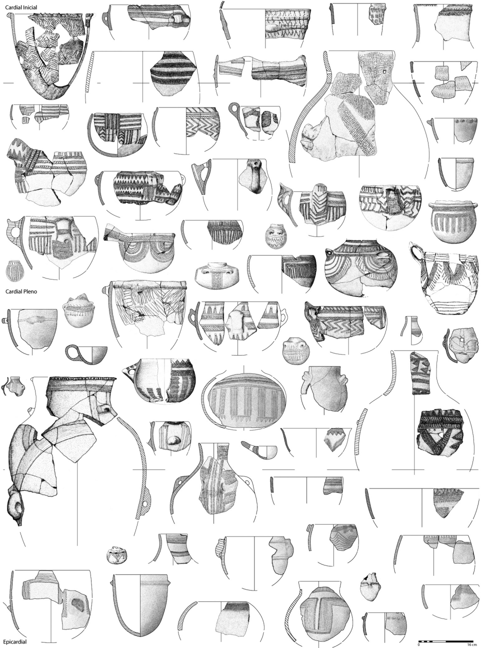
Figura 5. Propuesta de tendencia evolutiva de la cerámica de la Cova de la Sarsa durante el Neolítico antiguo.