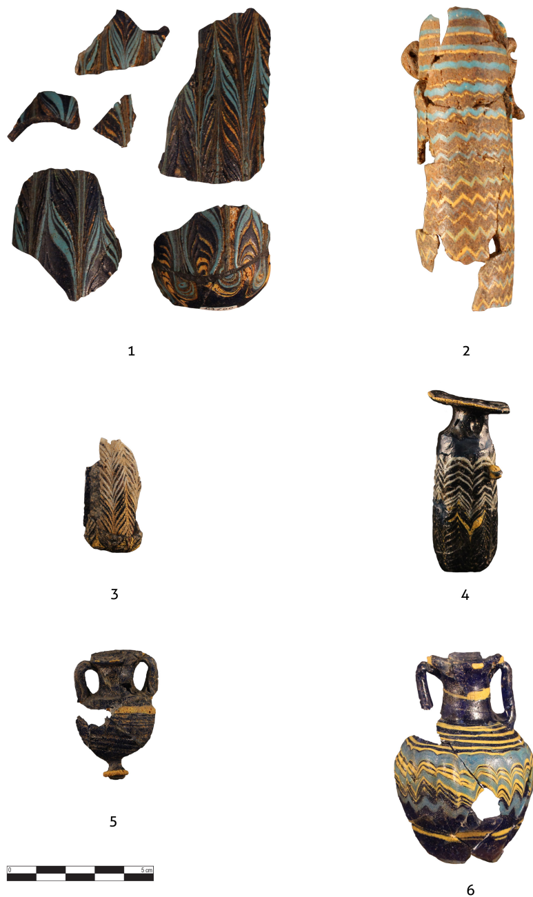
Figura 3. Alabastra (números 1 a 4) y amphoriskoi (números 5 y 6). 1: DJ698/DJ700; 2: DJ702; 3: DJ709; 4: DJ646; 5: DJ705; 6: DJ710.