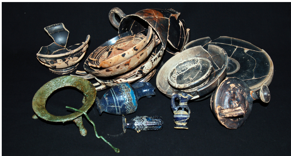
Figura 2. Objetos seleccionados aleatoriamente entre todo el conjunto.

se encuadra en la segunda mitad del I milenio a.C., concretamente en el segundo tercio del siglo IV aC que es cuando tiene lugar el ritual que da paso al depósito de Zacatín. En este momento, la producción vidriera se encuentra en un momento álgido (Adroher et al. , 2005: 38), posicionándonos en el Grupo Mediterráneo II de Grose (1989), en el que aparecerá esparcida por todo el Mediterráneo una serie de formas de inspiración griega ( amphorískoi , alábastra , oinokhóai y aryballoi ) 2 .