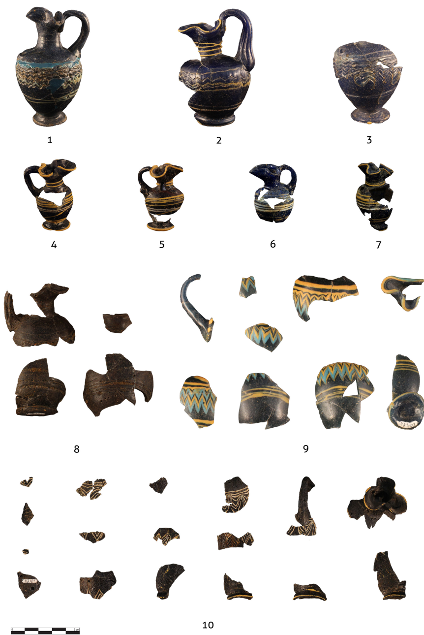
Figura 4. Oinokhóai de vidrio. 1: DJ645; 2: DJ711; 3: DJ709; 4: DJ703; 5: DJ706; 6: DJ704; 7: DJ707; 8: DJ701; 9: DJ714; 10: DJ699.