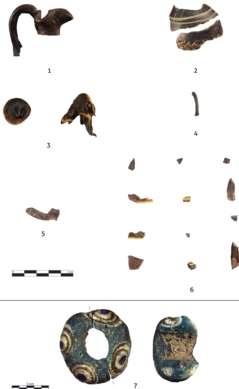
Figura 5. Oinochōai (números 1 a 3), amphoriskos (número 4), alabastron (número 5), grupo de fragmentos indeterminados (6) y cuenta de collar oculada (7). 1: DJ713; 2: DJ712; 3: DJ715; 4: sin numerar; 5: sin numerar; 6: fragmentos indeterminados; 7: cuenta de collar oculada.