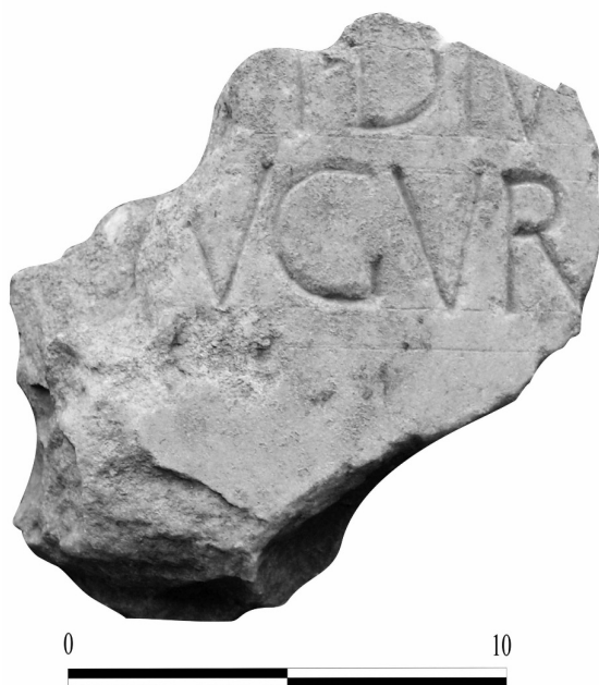
Fig. 3. Inscripción dedicada a Germánico.

del emperador Calígula, y en la que quedaban incluidas las gentes de los pequeños castros del entorno, que para esos momentos ya han desaparecido y cuyas poblaciones se encuentran insertas en el nuevo modelo territorial, de lo que se deduce que ahora la civitas puede ofrecer diversos origines .