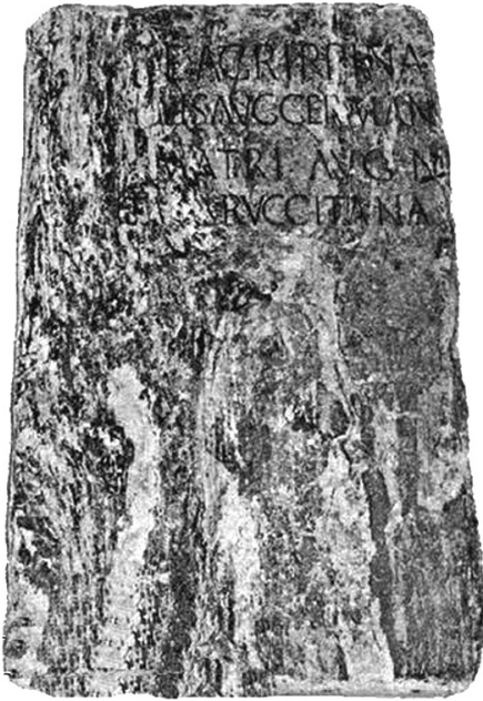
Fig. 2. Pedestal con inscripción honorífica dedicada a Mlia Agrippina por parte de la Civitas Aruccitana .

mente: tribus del entorno, existencia de ciudadanos romanos, contexto arqueológico e histórico, etc.