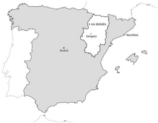
Figura 1. Situación de la ciudad romana de Los Bañales de Uncastillo (mapa: Óscar Ribote).