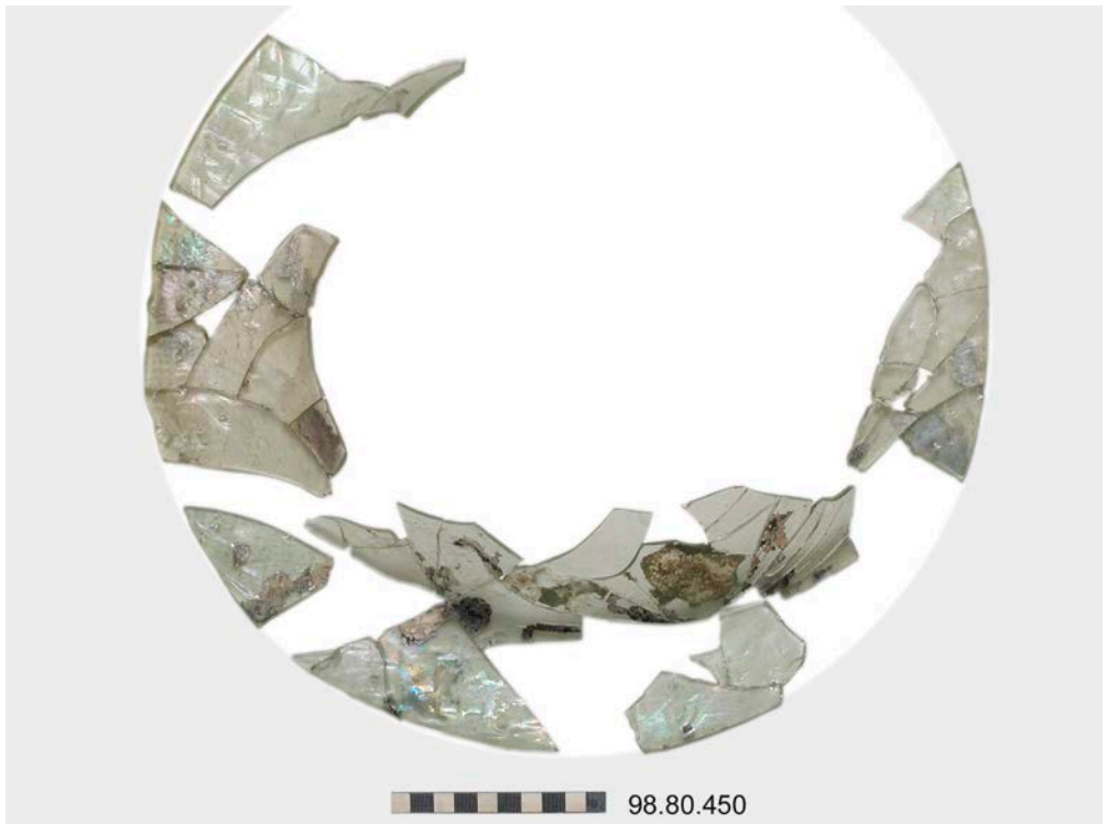
Figura 2. Montaje fotográfico de los fragmentos de ventana circular descubiertos por José M. a Viladés en el sector oeste de las termas públicas de Los Bañales de Uncastillo.