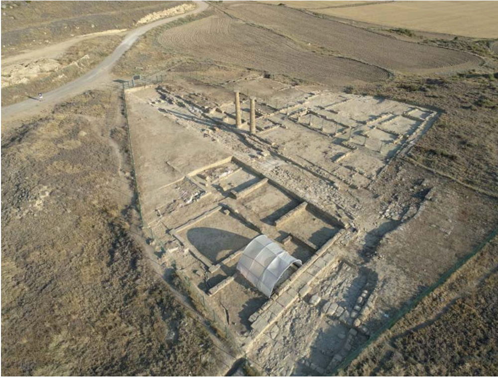
Figura 3. Vista cenital del barrio septentrional de la ciudad romana de Los Bañales de Uncastillo.

fragmento de vidrio con una marca textual en molde. Éste apareció con la característica pátina verdosa y escamada típica de los procesos de corrosión que afectan a los vidrios antiguos y, en particular, a los romanos. Tras su minuciosa limpieza y restauración (fig. 4), el fragmento ha resultado ser de pátina clara, traslúcido, de muy buena factura, compacto y sin apenas burbujas de gas. Mide 2,4 cm de largo y 1,2 cm de alto, con un espesor de 0,9 cm y con las letras capitales griegas HTIW —que, como veremos, muy probablemente debamos leer al revés—, de 0,5 cm de altura y entre 0,5 y 0,2 cm de ancho, en relieve y realizadas a molde, como era habitual en las producciones de vidrio soplado. La pieza, en concreto, procede del nivel de abandono del cardo oriental, donde, sobre el enlosado del citado cardo , fue hallada con materiales muy variados —sobre todo cerámica y elementos constructivos romanos del tipo tegulae o imbrices —, datados los más tardíos en torno a la segunda mitad del siglo II d. C. En esta fecha se iniciaría una crisis urbana local de notable alcance, como evidencia el descuido del callejero de la ciudad (Andreu et al. , 2020), que, desde una perspectiva epigráfica, parece convenir también con la datación del recipiente del que este fragmento formó parte, como veremos a continuación.